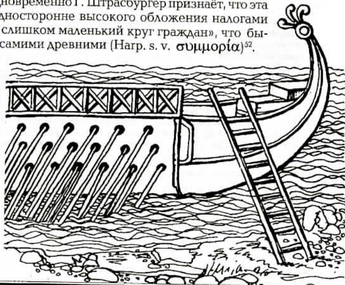
Трап, поданный на триеру. Фреска виллы Фарнезе.

Закон оставался в силе долгое время. Какое-то изменение внёс в него Эсхин (Dem., XVIII, 312; Aeschin., III, 222). Но суть их нам неизвестна, и они, кажется, не прижились 53 .