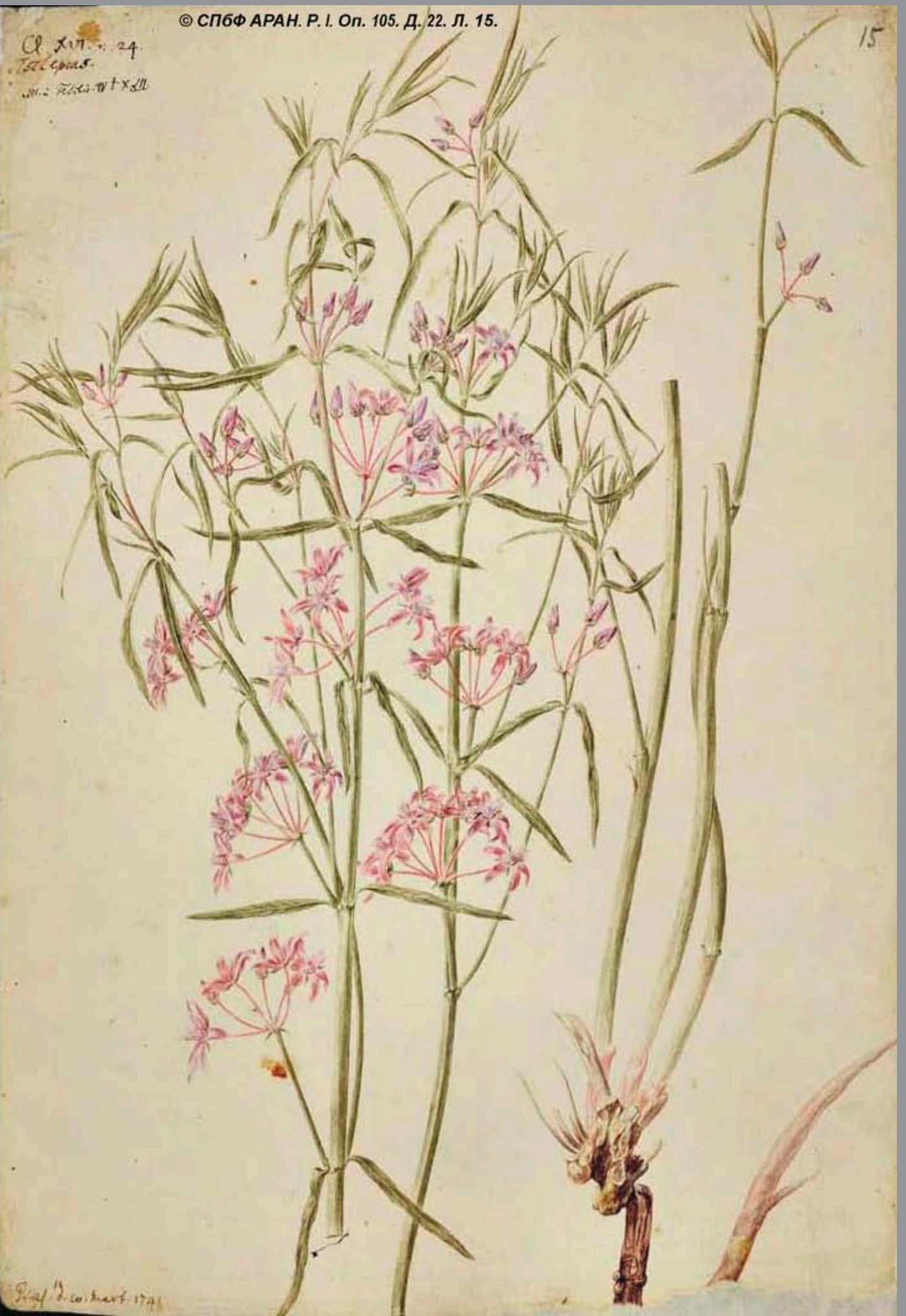
Рис. Д. С. Март. 1741

Сл. XII. 24. Теллерия. мн. Теллерия Х. 24.