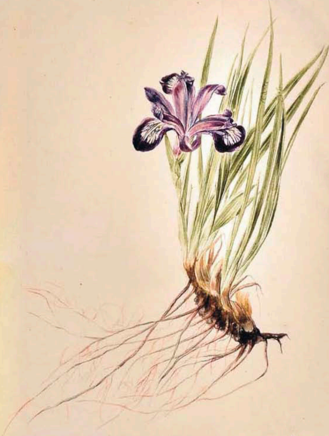
Tab. V. Fig. 1.