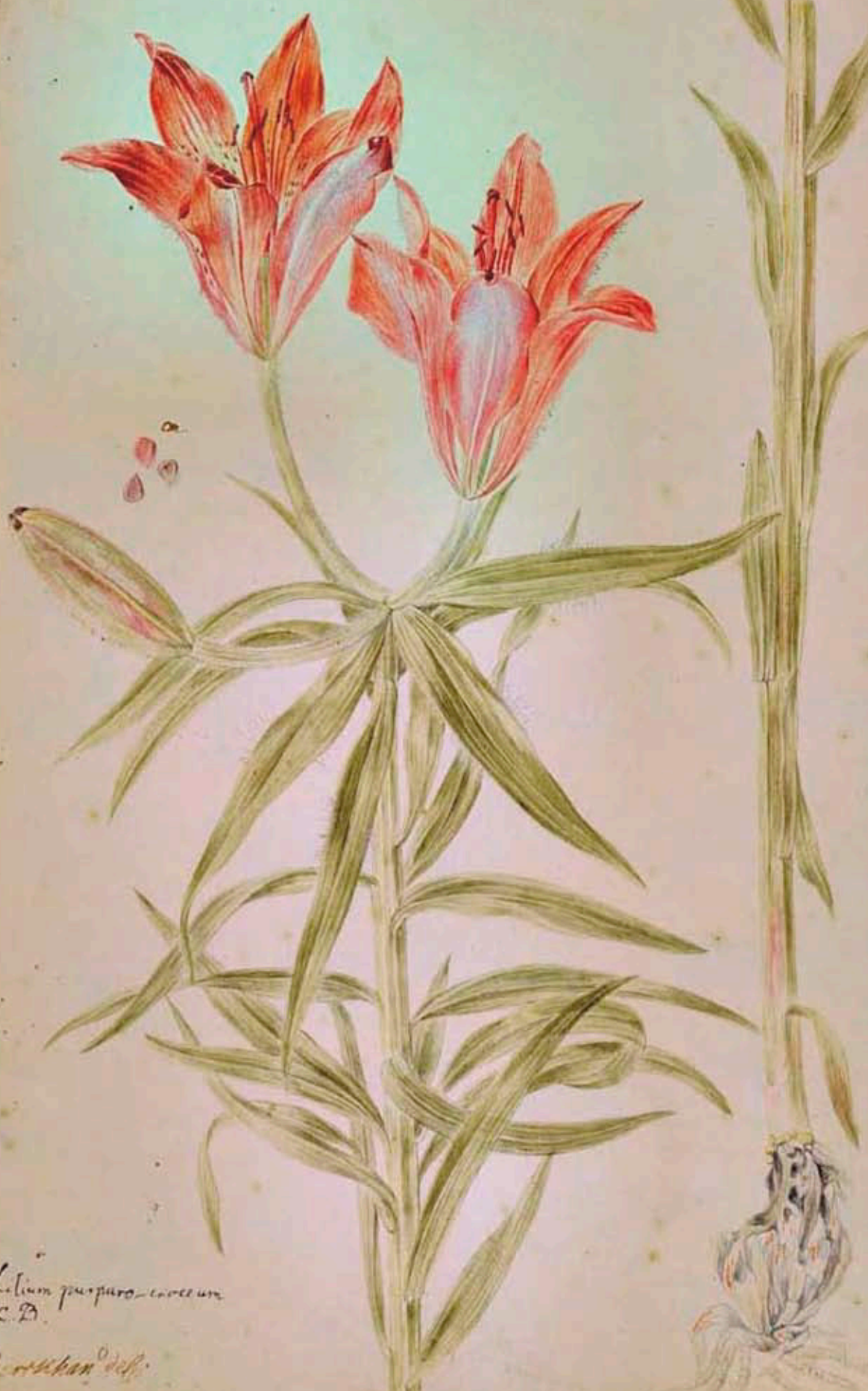
Lilium purpurococcineum C.D. P. ... del.