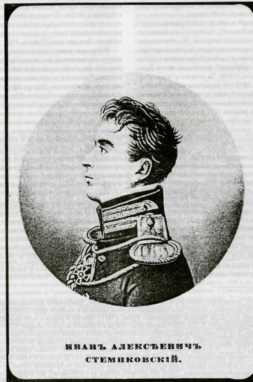
ИВАНЪ АЛЕКСѢЕВИЧЪ СТЕМПОВСКІЙ.