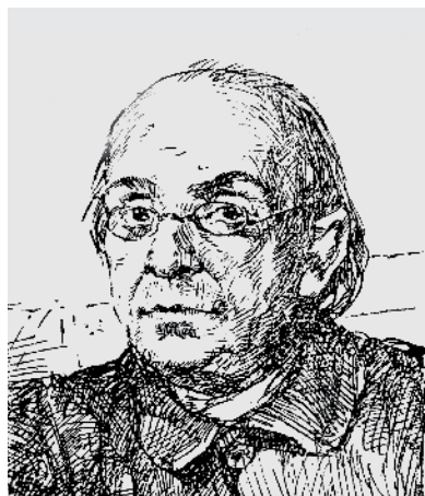
Б.В.Варнеке. Карандашный портрет. (Силуэты. 1924. № 5. С. 6)

Прибавим, что автор, будучи сам военным и специалистом-техником, севастопольский старожил и издавна на месте следит за древностями Крыма».