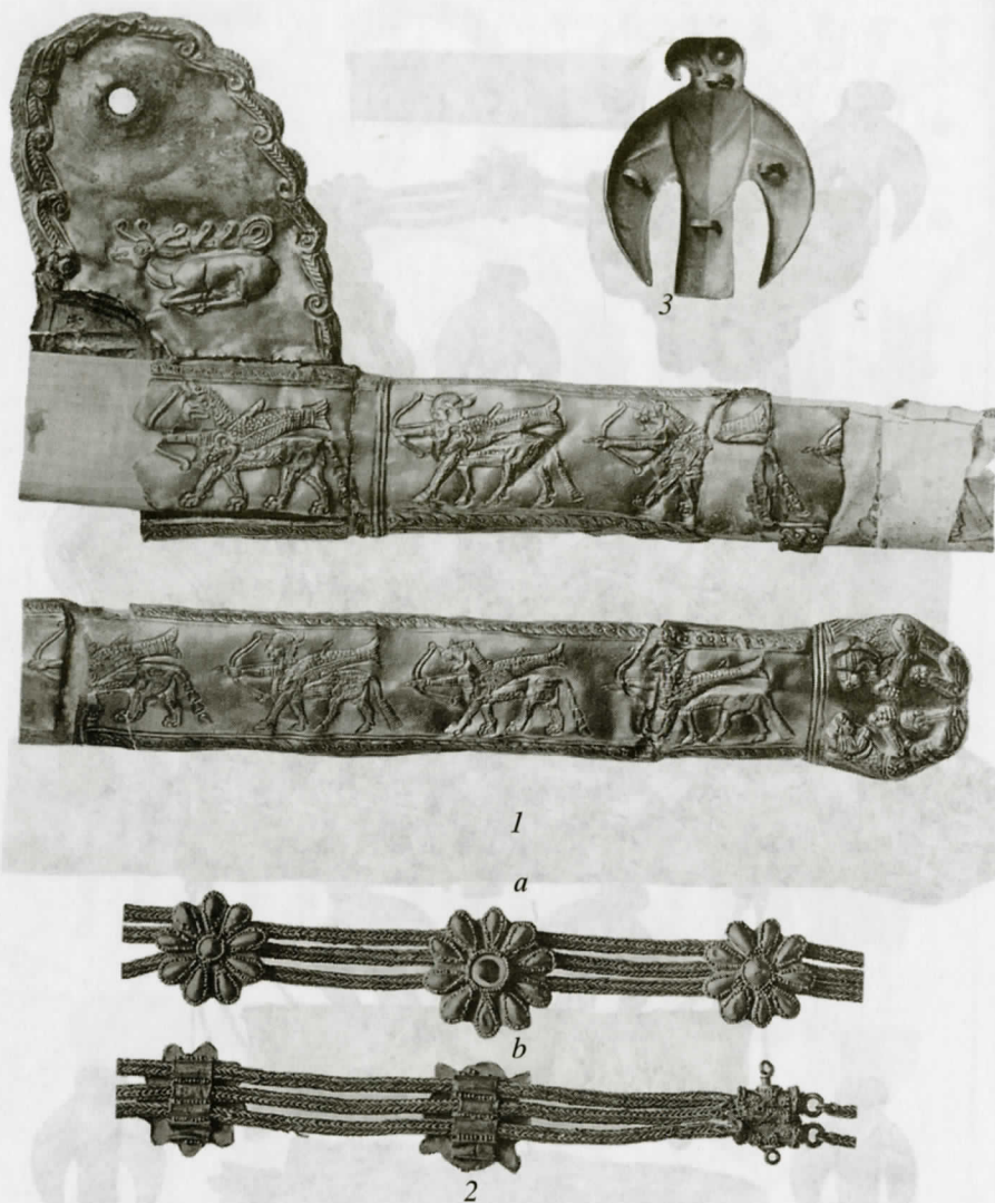
Рис. 5. Комплекс Литого кургана (по Е.М. Придику, табл. 4): 1 – оборотная сторона ножен с выступом; 2 – детали диадемы: а) середина ее с лицевой стороны; б) конец ее с оборотной стороны; 3 – птица с оборотной стороны