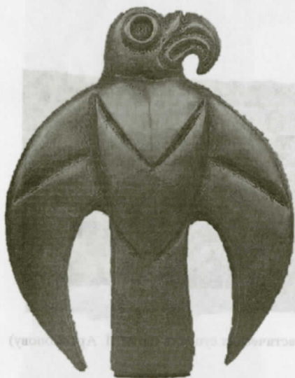
Рис. 14. Золотая бляха в виде хищной птицы (по Л. Галаниной и Н. Грач)