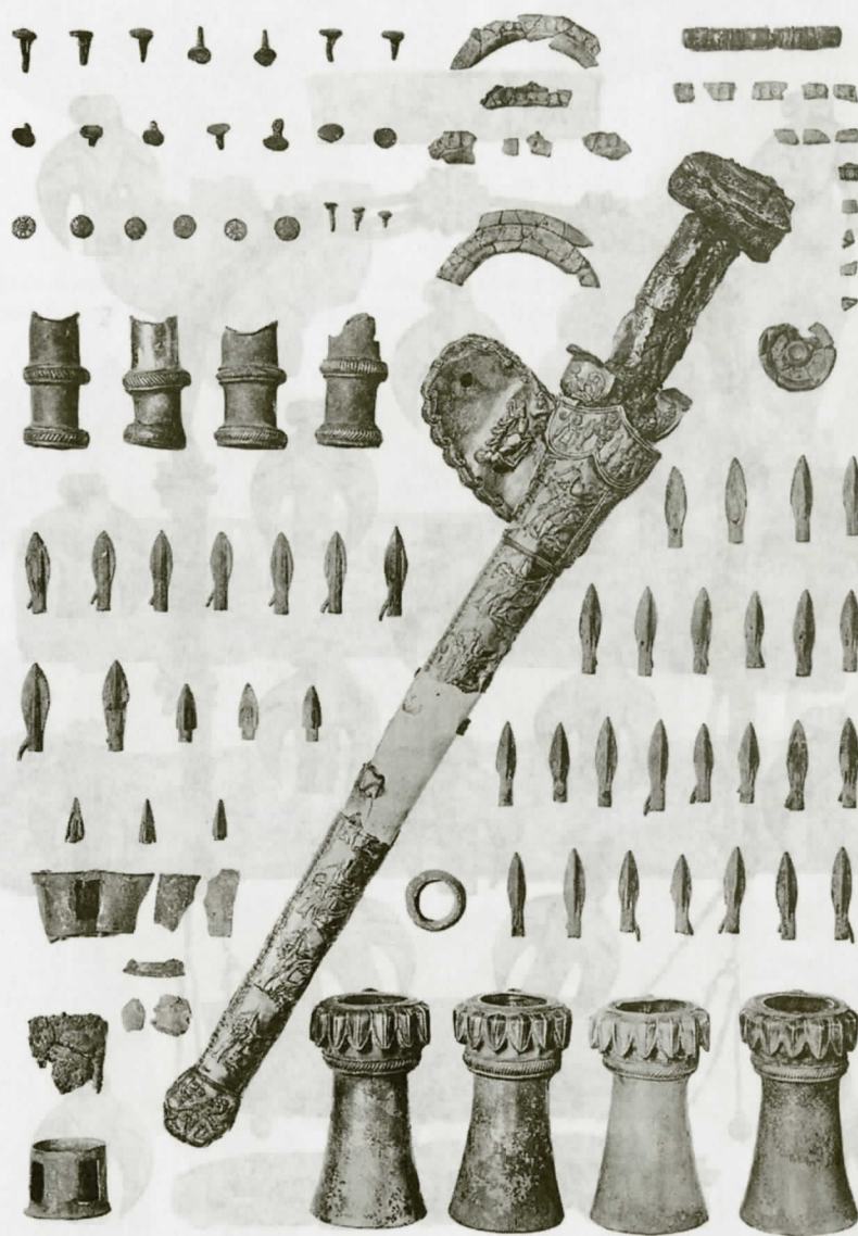
Рис. 2. Комплекс Литого кургана (по Е.М. Придику, табл. 1): рукоять меча, серебряные обломки, четыре серебряных «столбика», четыре маленьких «столбика», круглые серебряные цилиндрики, сорок наконечников стрел, двадцать три гвоздя и бронзовая палочка. См. Придик Е.М. Мельгуновский клад 1763 г. ...