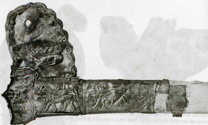
Рис. 9. Золотая о кладка ножен меча, деталь – верхняя часть с выступом. Нег. II-9203