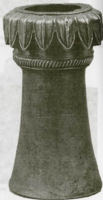
Рис. 15. Наконечник ножки дворцового табурета для ног. Серебро, золото (по Л. Галаниной и Н. Грач)