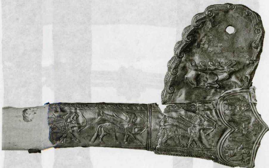
Рис. 10. Золотая о кладка ножен меча, деталь – верхняя часть с выступом, вид с другой стороны.