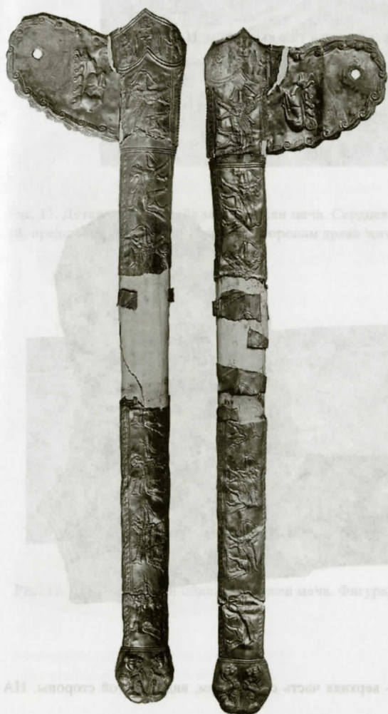
Рис. 7. Золотая обкладка ножен меча, вид с обеих сторон. НА ИИМК РАН, ф/о. Нег. III-9011