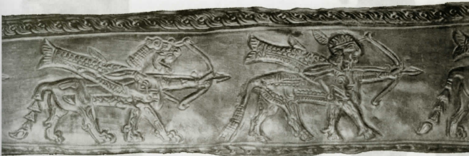
Рис. 12. Деталь золотой обкладки ножен меча. Фигуры фантастических существ (по М.И. Артамонову)