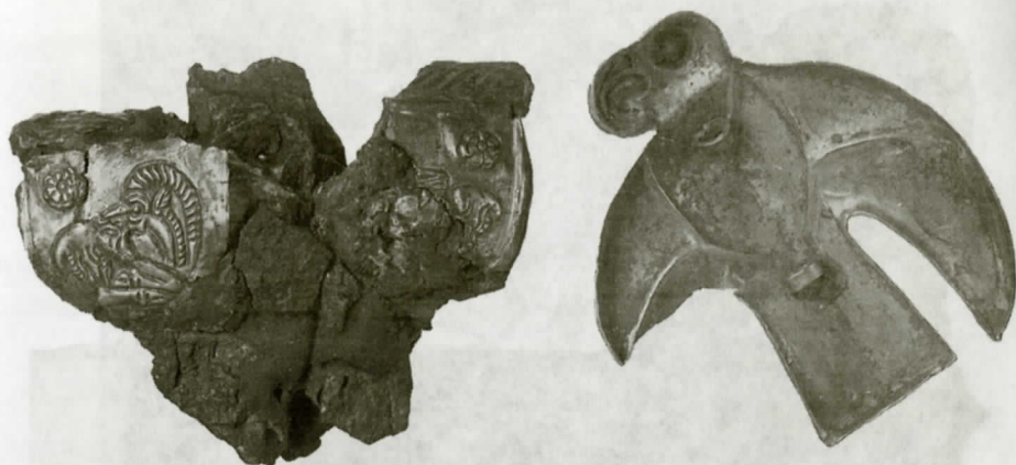
Рис. 6. Деталь золотой обкладки перекрестья рукояти меча с рельефной фигурой лежащего козла, оборотная сторона золотой блины в виде хищной птицы. НА ИИМК РАН, ф/о. Нег. П-27845