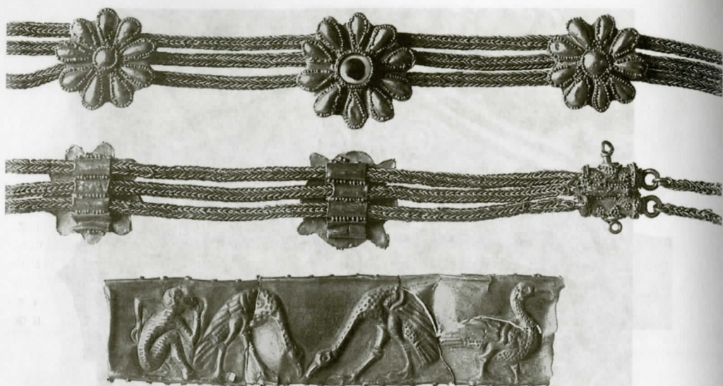
Рис. 13. Детали золотой диадемы с лицевой и оборотной сторон, золотая пластина с изображением обезьяны и птиц.