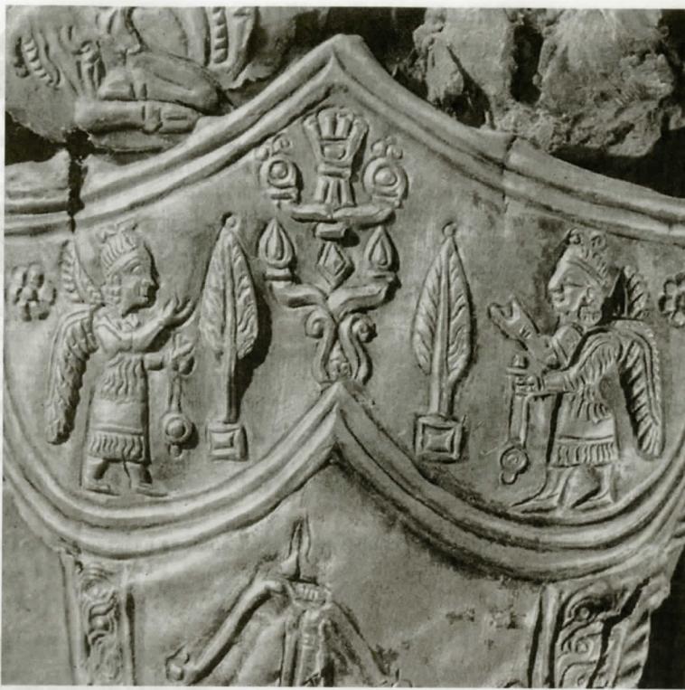
Рис. 11. Деталь золотой обкладки ножен меча. Сердцевидное расширение на верхнем конце с композицией, представляющей двух гениев по сторонам дерева жизни (по М.И. Артамонову)