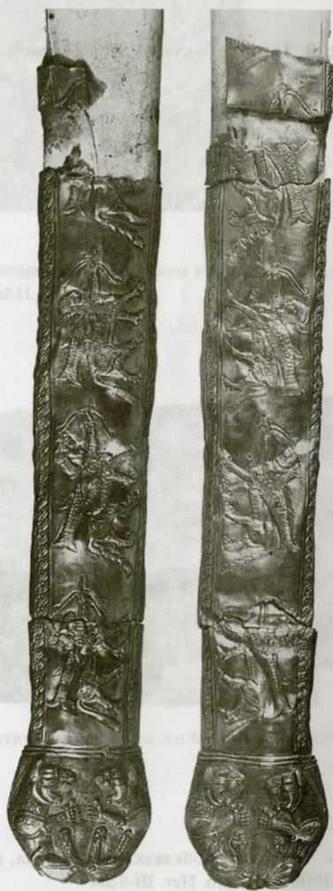
Рис. 8. Золотая обкладка ножен меча, нижняя часть и бутероль, вид с обеих сторон.