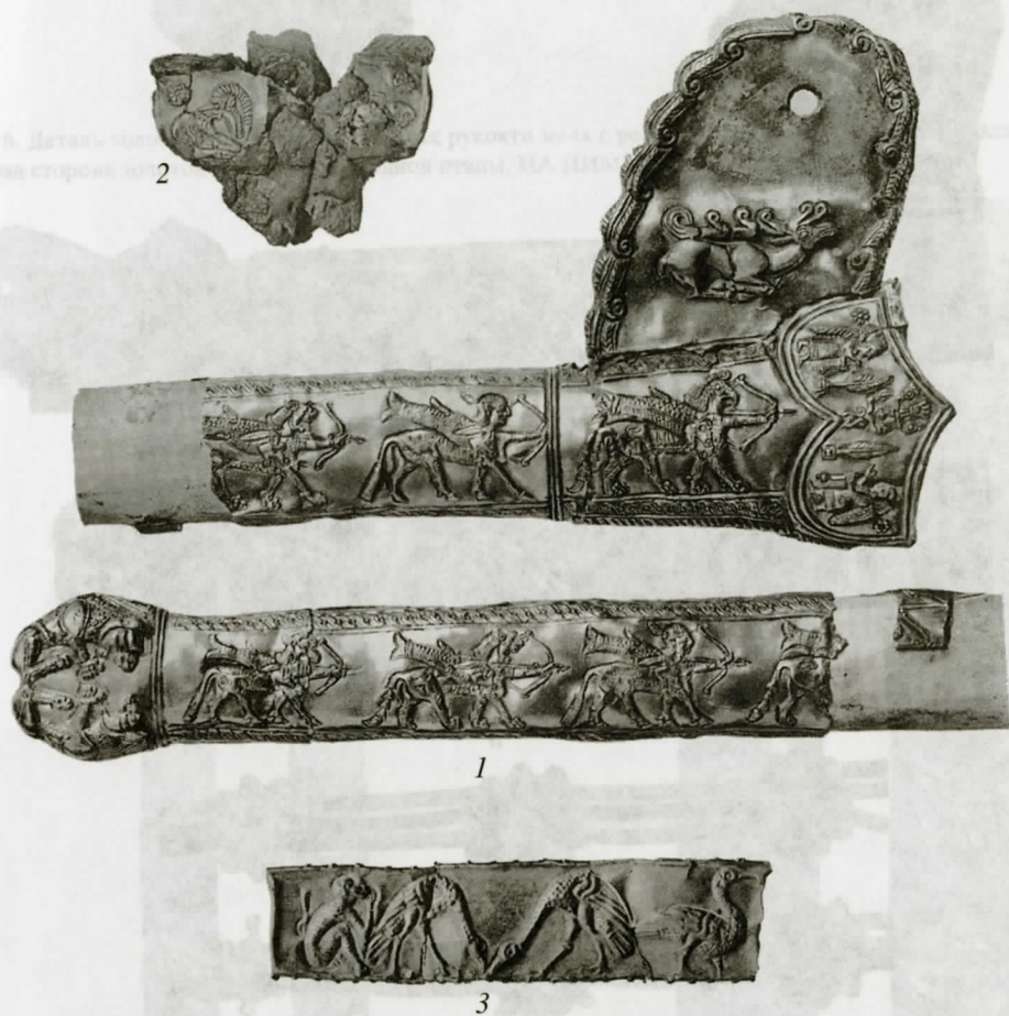
Рис. 4. Комплекс Литового кургана (по Е.М. Придику, табл. 3): 1 – лицевая сторона ножен с выступом (с. 7 сл.); 2 – нижняя сердцевидная часть рукоятки меча; 3 – золотая пластинка

Рис. 7. Золотая обкладка навершия меча, вид с обеих сторон. НА ИИМК РАН, ф.4/ Инв. III-9011