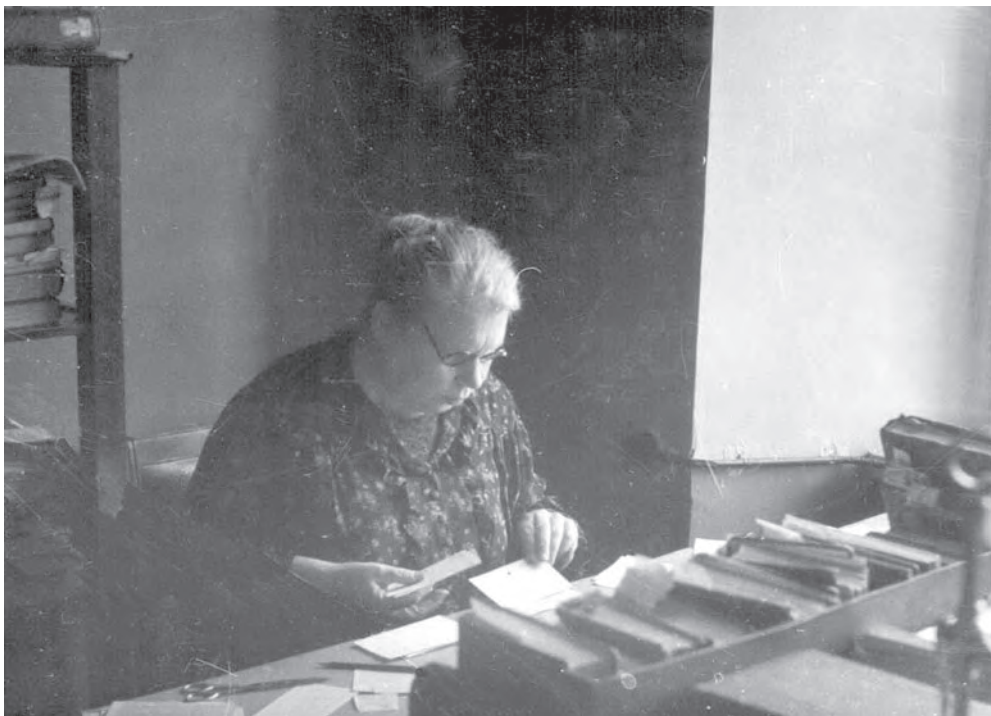
Е.Э. Бломквист за рабочим столом.

Имя Евгении Эдуардовны Бломквист (1890–1956) — ленинградского этнографа, специалиста в области славистики и американистики — хорошо известно историкам, этнографам и искусствоведам [Евгения Эдуардовна Бломквист 1956: 170–173; Станюкович 1992: 78–84; Сагнаева 1992: 84–90]. Ее научная работа была связана с двумя крупнейшими этнографическими центрами города — Этнографическим отделением Русского музея (впоследствии Государ-